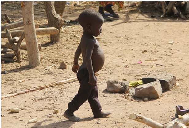
Traurige Hungersnot im Extrême North