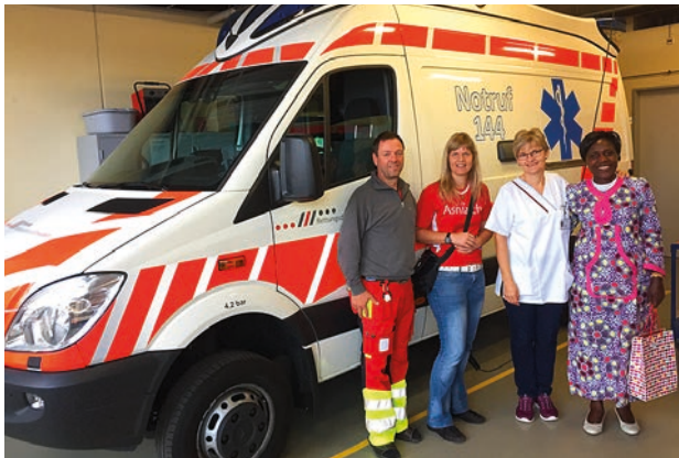
Zu Besuch im Spital Einsiedeln