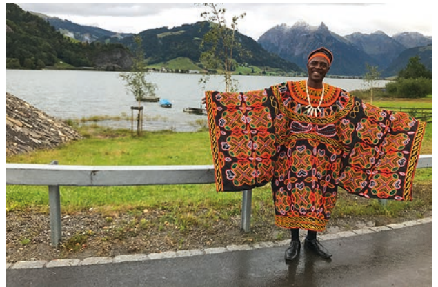
Fotoshooting am Sihlsee