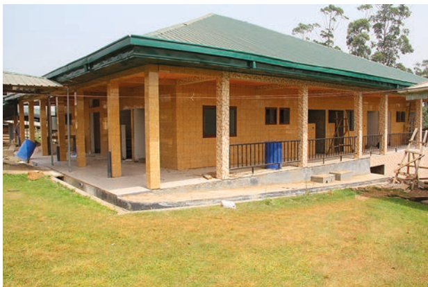
Aufbau unseres Operationssaals in Bali Nyonga