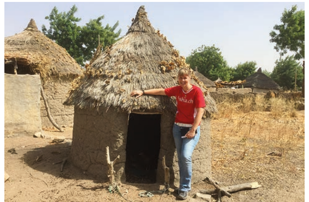
Einfachste Lebensweise im Extrême North