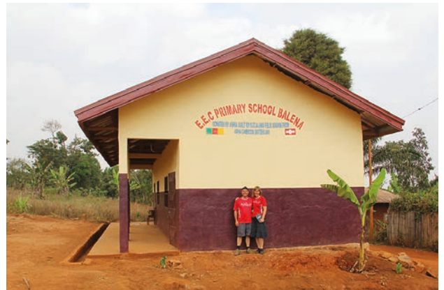
Unser neues Primarschulhaus in Less Wouroum