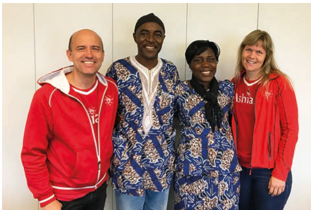
Das Ashia-Team in der Schweiz vereint