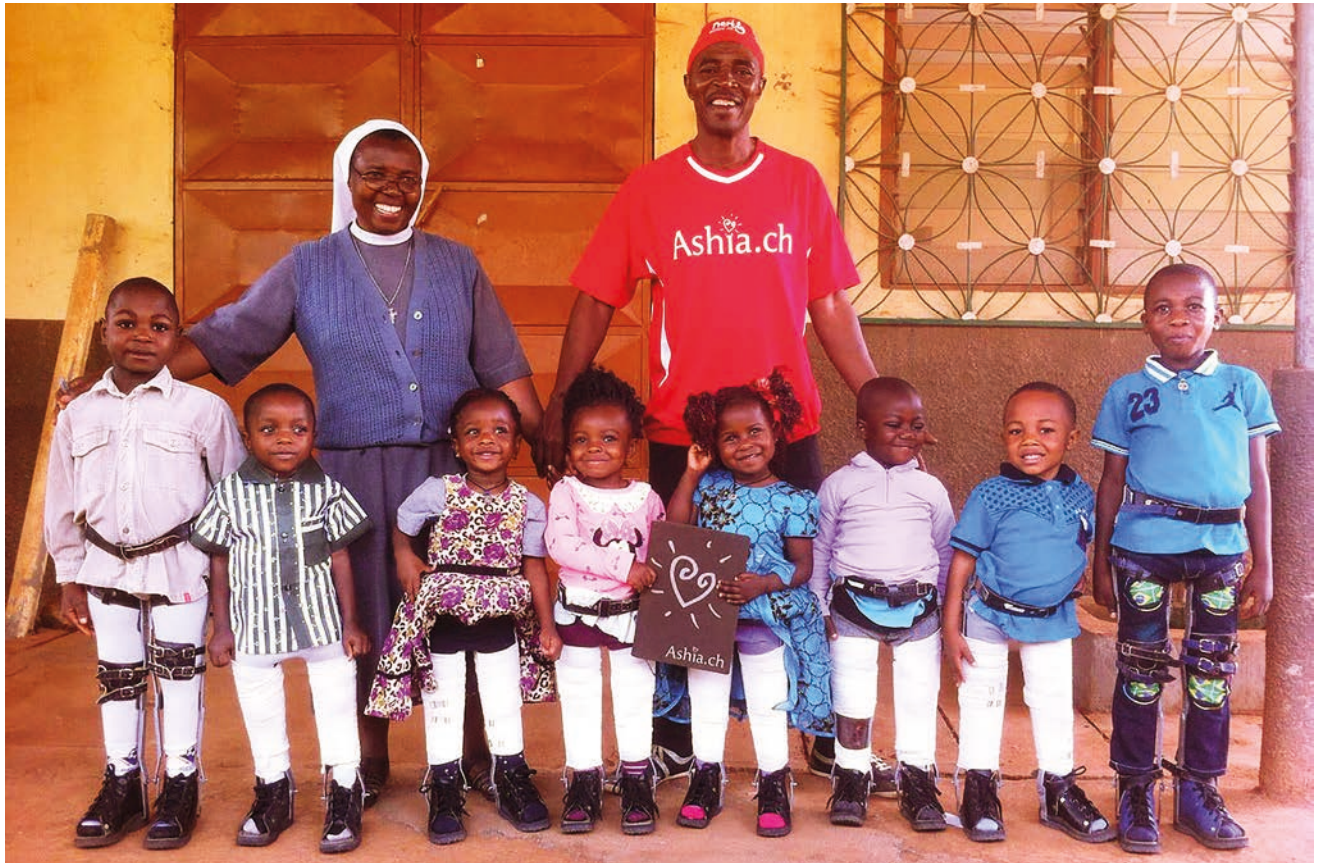
oben Februar 2017: Die ersten Kinder der Operationen von Ende 2016 dürfen nach Hause unten November 2017: 8 durch Ashia finanzierte Kinder vor ihrer Beinoperation